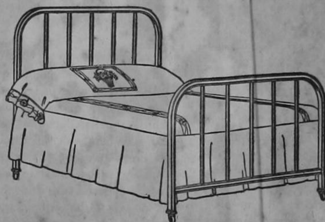
COCINAS PARA LEÑA